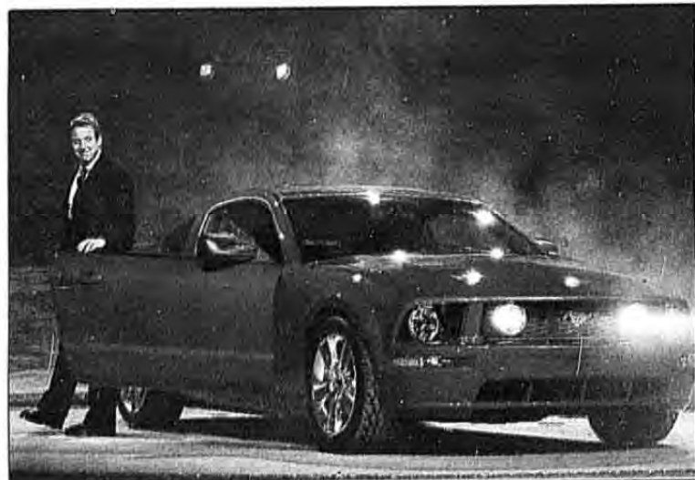
Ford-sjefen Bill Ford Jr., her midt i eksos-skyen, har ord på seg for å være engasjert i miljøspørsmål.

IA ble inngått mellom myndighetene og partene i arbeidslivet høsten 2001. En rekke tiltak er satt i verk for å nå målet om å redusere sykefraværet med 20 prosent fra 2. kvartal 2001 til utgangen av 2005. Det betyr at sykefraværet skal ned fra 7 prosent til 5,6 prosent. Etter fire år er partene halvveis til målet. De gjenstår et halvt år på å klare den andre halvparten.