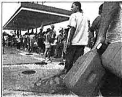
Helt Texas foran amerikanske bensinpumper før helgen. Også EU forbereder seg på krise.

OSLO BØRS -0,1% ▼ NEW YORK -0,0% ▼ LONDON +0,5% ▲ EURO 7,79 ▲ (+0,01 kr.) DOLLAR 6,43 ▲ (+0,07 kr.) OLJE (Brent) 62,73 ▼ (-1,87$) Dollar/fat - 1 måned (kl. 18.00)